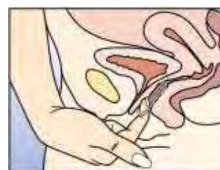
Abbildung 5 NuvaRing kann entfernt werden, indem man den Zeigefinger unter dem Ring einhakt oder den Ring mit Zeige- und Mittelfinger greift und herauszieht.

Legen Sie den Ring mit einer Hand in die Scheide ein (Abbildung 4A); falls notwendig, können die Schamlippen mit der anderen Hand gespreizt werden. Schieben Sie den Ring in die Scheide, bis sich der Ring angenehm eingepasst anfühlt (Abbildung 4B). Lassen Sie den Ring für 3 Wochen in dieser Position (Abbildung 4C).